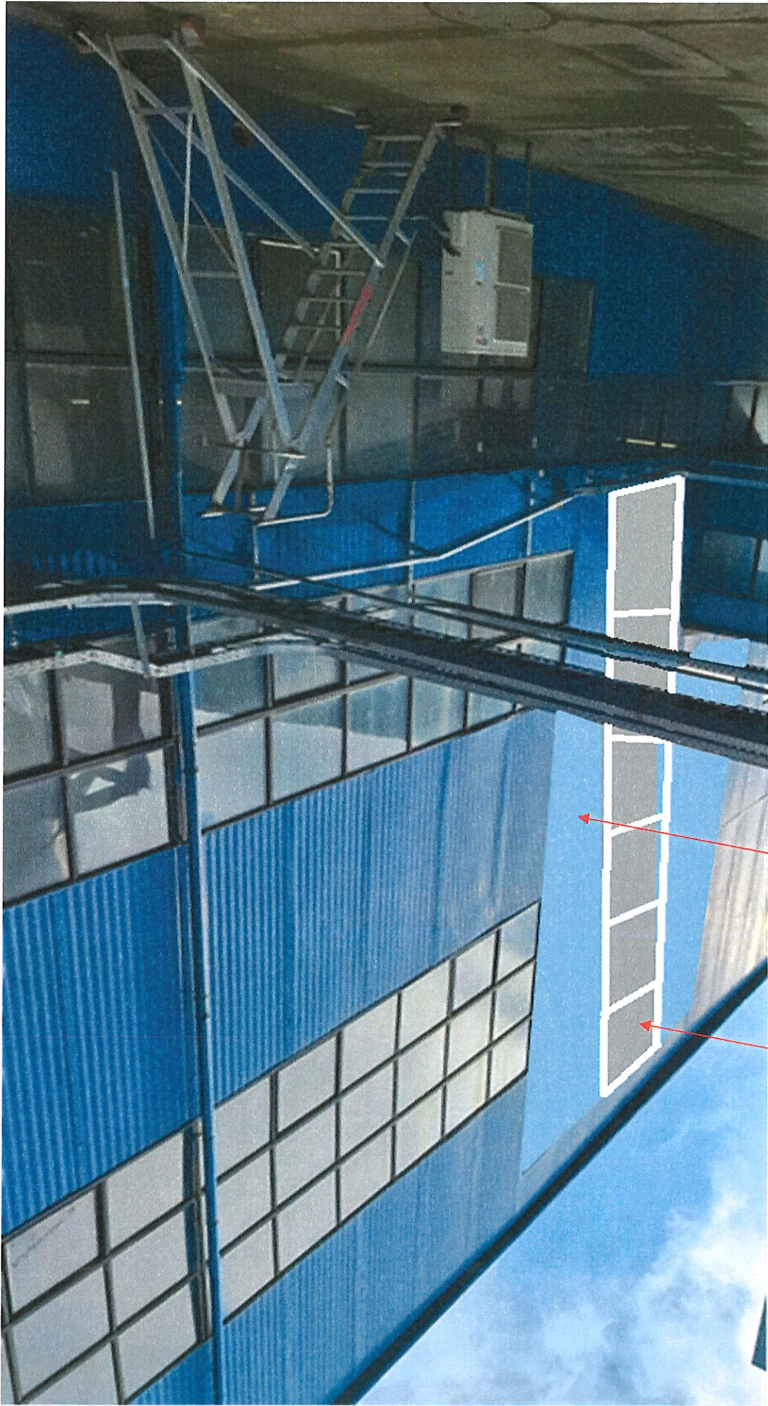
Elewacja Ciepłowni C-13 wykonana z płyty izolacyjnej warstwowej ściana C