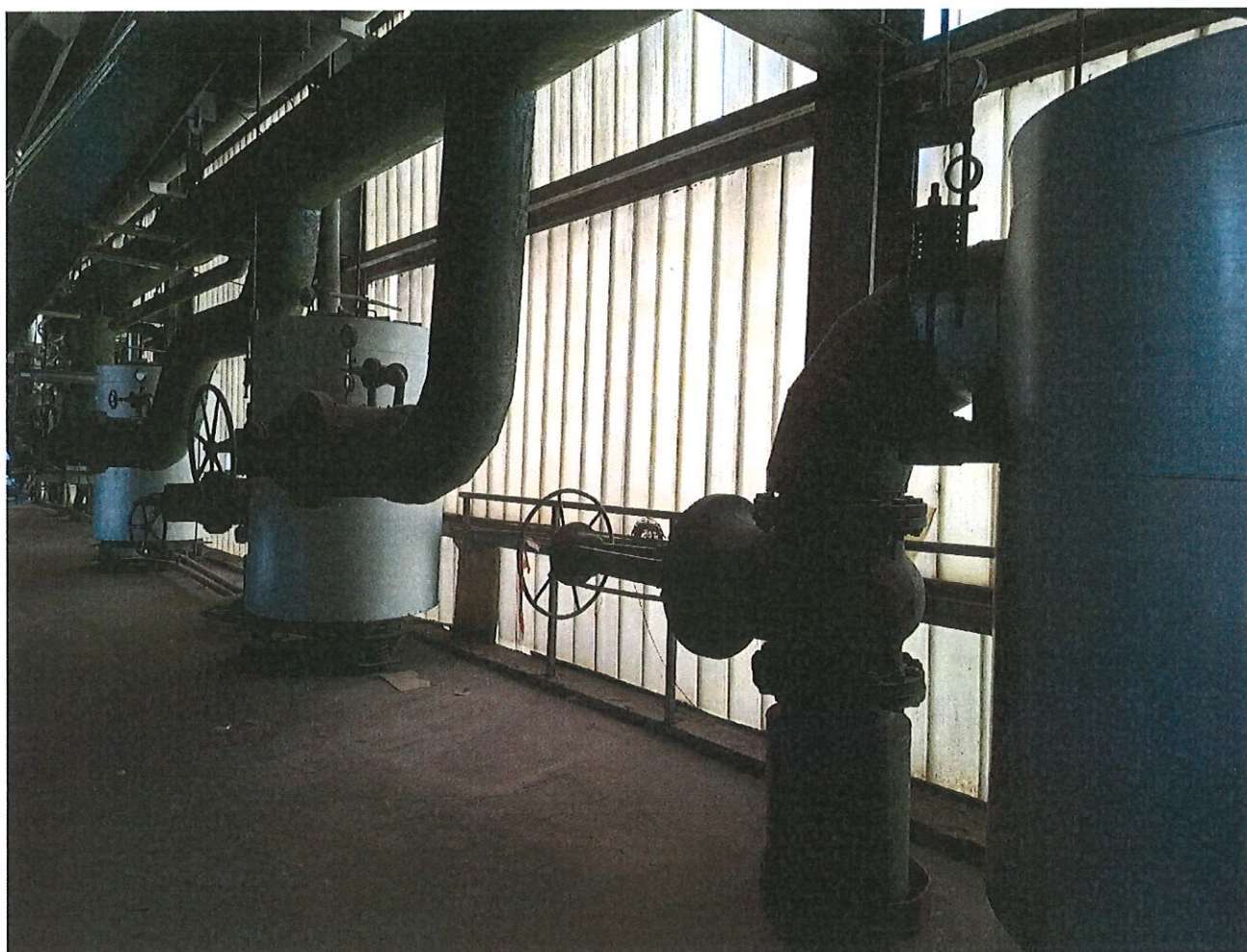
Widok paneli szklanych II piętro